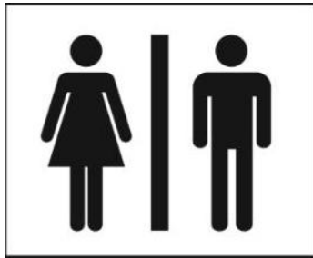
Micción (orina) frecuente/ Mojar la cama en niños(as)

Es posible que una persona no siempre reconozca los síntomas de un nivel alto de glucosa en sangre. Estos síntomas comunes, y otros, pueden indicar niveles altos de glucosa en sangre.