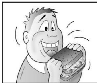
Aumento del hambre