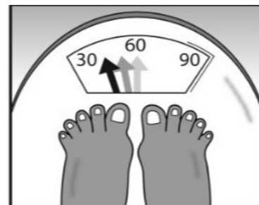
Perdida de peso inusual

Si una persona tiene dificultad para respirar, la debilidad, está confundida o inconsciente, Busque Asistencia Médica.