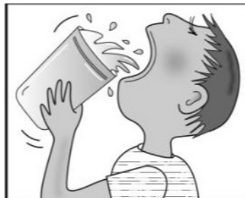
La boca seca y sed extrema